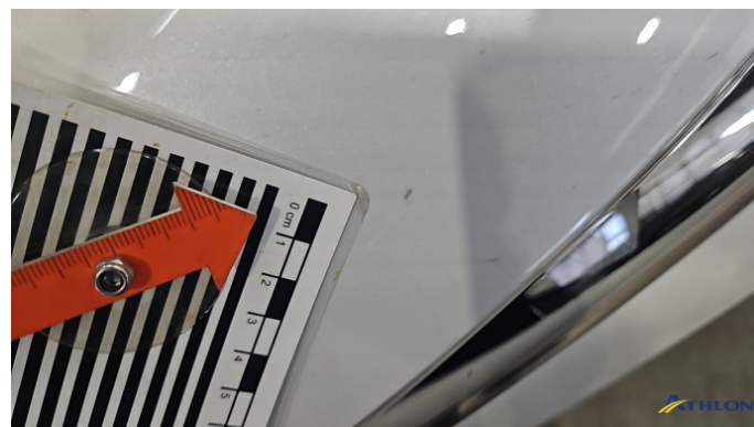
1. Motorhaube Steinschlag