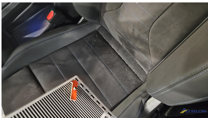
2. Sitz - Vorne - Links Gebrauchsspuren