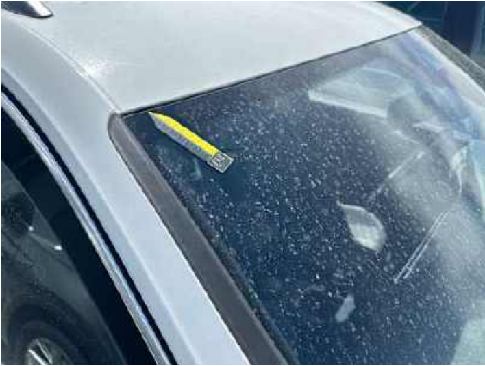
Dach (Steinschlag, Rost)